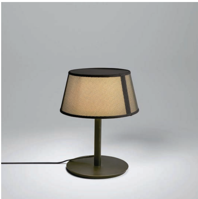
TABLE LAMP 558.32

Struttura realizzata da un'asta e da una base circolare in metallo, verniciati a polveri epossidiche, a cui si ancora il paralume rivestito in tessuto a rete nera. Structure made of a pole and a circular metal base, coated with epoxy powders, to which the lampshade is also covered with black mesh fabric.